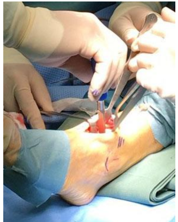
阪奈中央病院: 人工距骨置換術