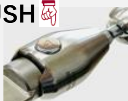
クイックコネクター仕様 (ワンタッチ脱着式)