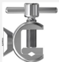
スタンダード仕様 (挟み式)