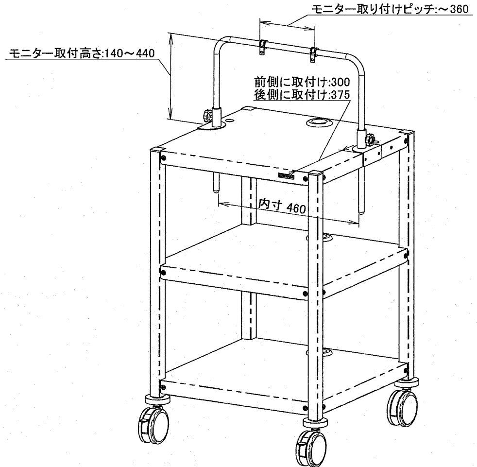
【DTW-1001TB】幅550奥行550 棚3段 転倒防止金具付仕様